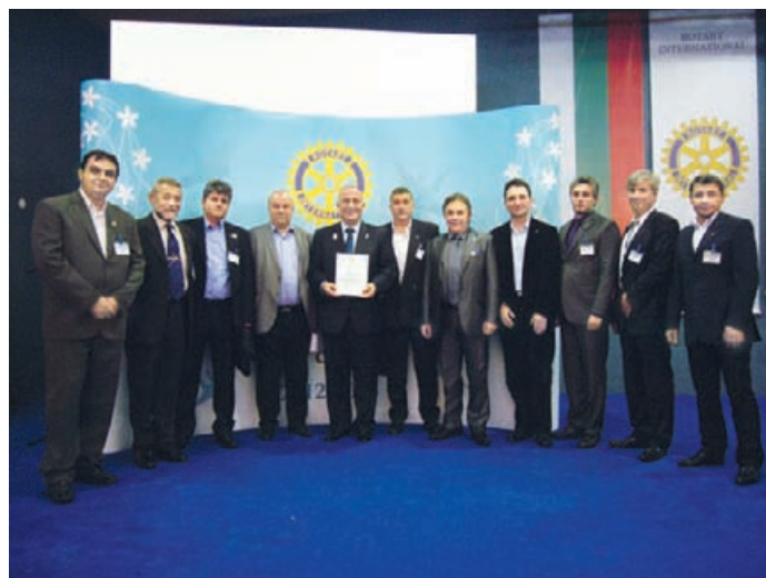
Президентите на клубове получиха сертификатите си за участие по зони