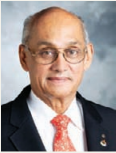
В Интернет Речи и новини от президента на РИ Калян Банерджи ще намерите на www.rotary.org/president