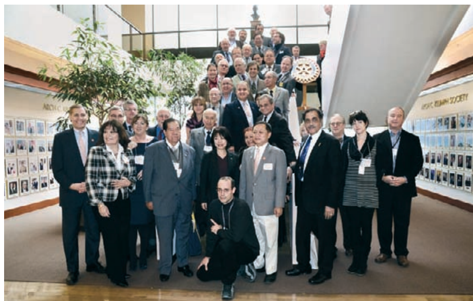
Представителите на регионалните списания с генералния секретар на РИ Джон Хюко в Залата на славата