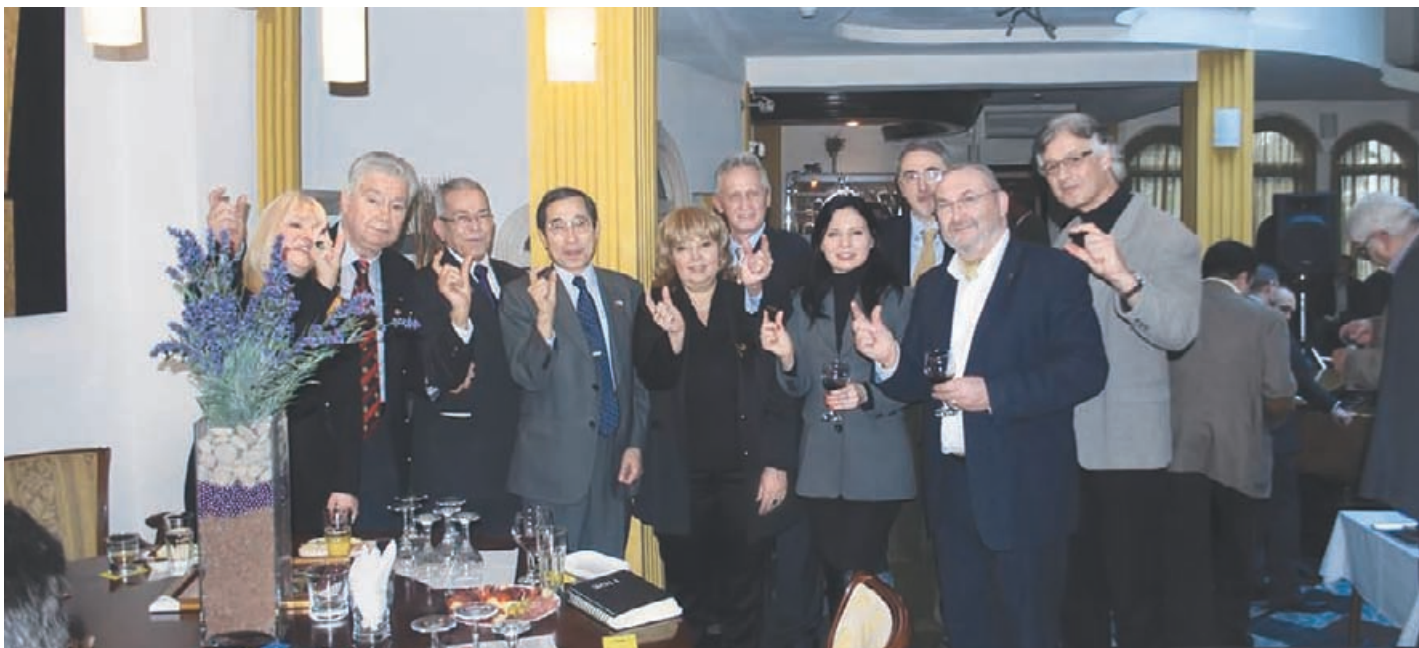
Учесници семинара поручују да је крај Полиа близу

На крају поглавља о Ротарију, аутор се пита: „Шта повезује лидере и ротаријанце? Овај однос је много сложенији и дубљи. Ротаријанци су лидери. Таква је њихова позиција. Тако је направљен Ротари покрет. Ротари окупља најбоље у својој професији. То је покрет лидера. На неки начин, он је и школа лидера. У извесном смислу, производи лидере. Са једне стране лидери долазе у Ротари, са друге, у Ротари долазе млади људи, који из Ротарија излазе као лидери. Не одлазе. Него кроз Ротари и у Ротарију постају лидери и преко Ротарија улазе у свет лидера, директно, без посредника“.